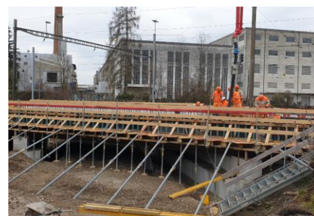
Neue Brücke Fabrikkanal (Vorbereitung neben den Gleisen)

Der BLS Kundendienst ist täglich zwischen 7.00 und 19.00 Uhr für Sie da. Sie erreichen uns unter: +41 (0)58 327 31 32 oder über unser Kontaktformular auf bls.ch/kundendienst