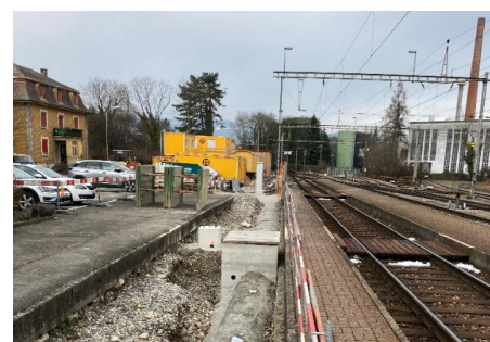
Neue Kabelanlagen Bhf Biberist Ost